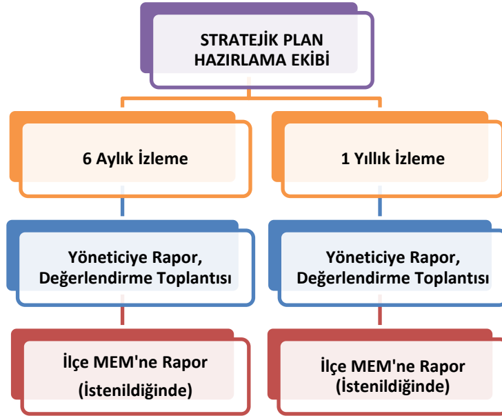
Şekil 2 İzleme ve Değerlendirme Süreci

Müdürlüğümüzün 2024-2028 Stratejik Planı İzleme ve Değerlendirme sürecini ifade eden İzleme ve Değerlendirme Modeli hazırlanmıştır. Okulumuzun Stratejik Plan İzleme-Değerlendirme çalışmaları eğitim-öğretim yılı çalışma takvimi de dikkate alınarak 6 aylık ve 1 yıllık sürelerde gerçekleştirilecektir. 6 aylık sürelerde Okul Müdürüne rapor hazırlanacak ve değerlendirme toplantısı düzenlenecektir. İzleme-değerlendirme raporu, istenildiğinde İlçe Milli Eğitim Müdürlüğüne gönderilecektir.